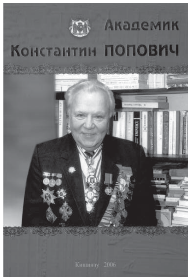
O ediție memorabilă: Viața și Opera acad. Constantin Popovici între copertele unui tom antologic

Și mai știu că această Literatură, cât timp îl are în Basarabia și Bucovina pe academicianul Constantin Popovici, nu se zbate în zadar. Există pentru viitorime, având un trecut demn și un prezent plin de anxietate. Și mai știu că Thales a stat 4 ani imobilizat, total nemișcat, dar la capătul acestui supliciu carnal a pus bazele științei filosofice. Sunt ferm convins de faptul că voi fi întrebat într-o zi de unii semeni de-ai noștri: „La ce ne mai trebuie scriitorii, gânditoriiăștia, doar sunt niște leneși și niște trândavi?”. Și mai știu și ce le voi răspunde, privindu-le cu indulgență neștiința crasă: „Pentru mine, în comparație cu voi, scriitorii, cugetătorii nu sunt niște leneși și niște trândavi, sunt niște suflete zvăpăiate. Este mare nevoie de scriitori, de cei care cugetă și scriu neconținut, în primul rând, este nevoie pentru a spăla troglodirea celor care nu gândesc și nu scriu niciodată”. Și gândul îmi va tresări ca o săgeată slobozită din arc, îmi va fugi năvalnic spre Eminescu al academicianului Constantin Popovici, care este Eminescu nostru, al tuturor, al Universului întreg.